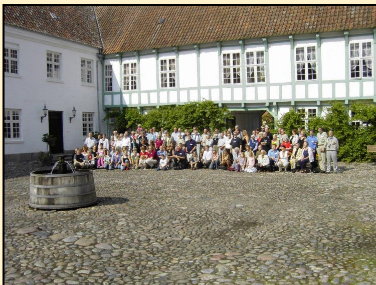
Familietræf på Lynderupgaard 2004.